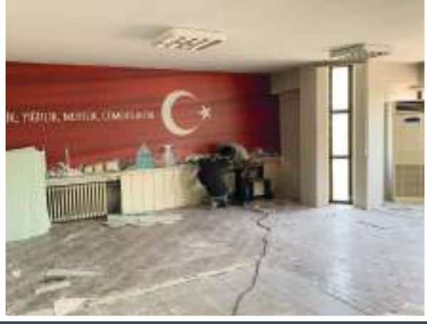
Toplantı Odası Öncesi