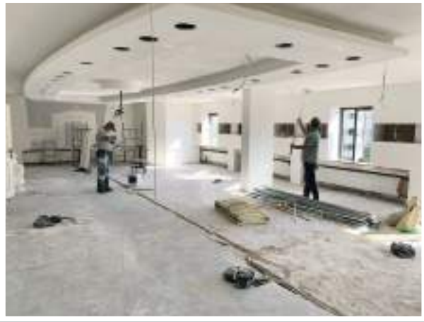
Toplantı Odası Öncesi