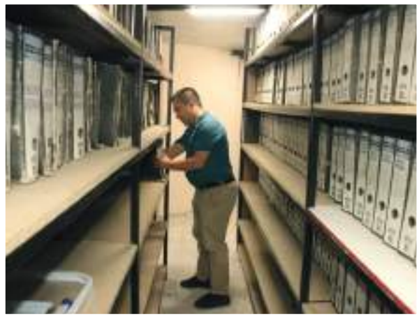
Arşiv Bölümü yenilendi