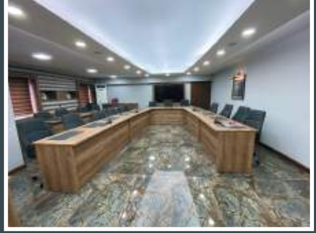
Toplantı Odası Sonrası