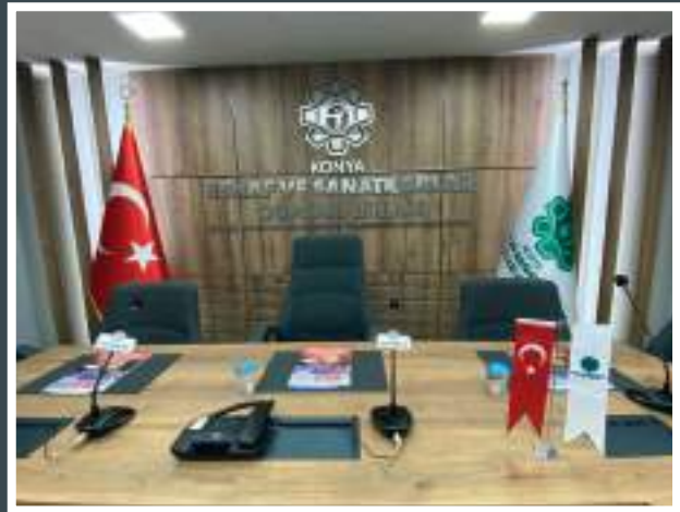
Toplantı Odası Sonrası