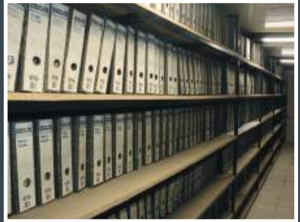
Arşiv Bölümü yenilendi