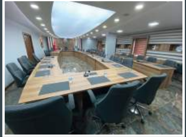
Toplantı Odası Sonrası