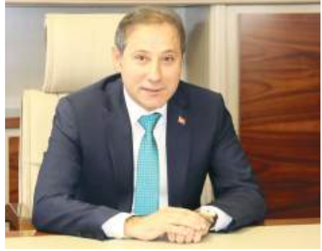
Başkanı Karabacak konuyla ilgili şu bilgileri verdi:

Kalfalık ustalık belgesi olanların meslek lisesi mezunu olmaları yönünde Milli Eğitim Bakanlığı'nın yeni düzenlemeler yaptığını hatırlatan KONESOB