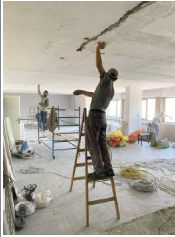
Toplantı Odası Öncesi

Yıl içinde Esnaf ve Sanatkarlar Odaları Birliği, yeni arşiv bölümüne kavuştu ve toplantı odasının tadilatı gerçekleştirildi.