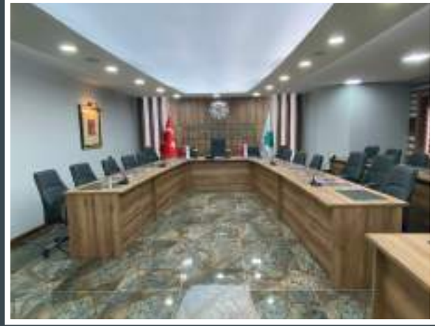
Toplantı Odası Sonrası